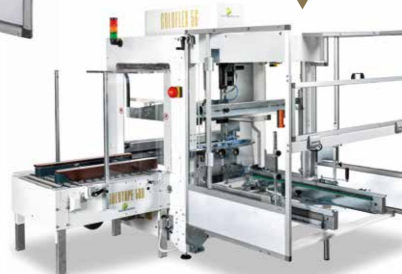
GOLDFLEX CON MAGAZZINO MOTORIZZATO WITH POWERED MAGAZINE ▼