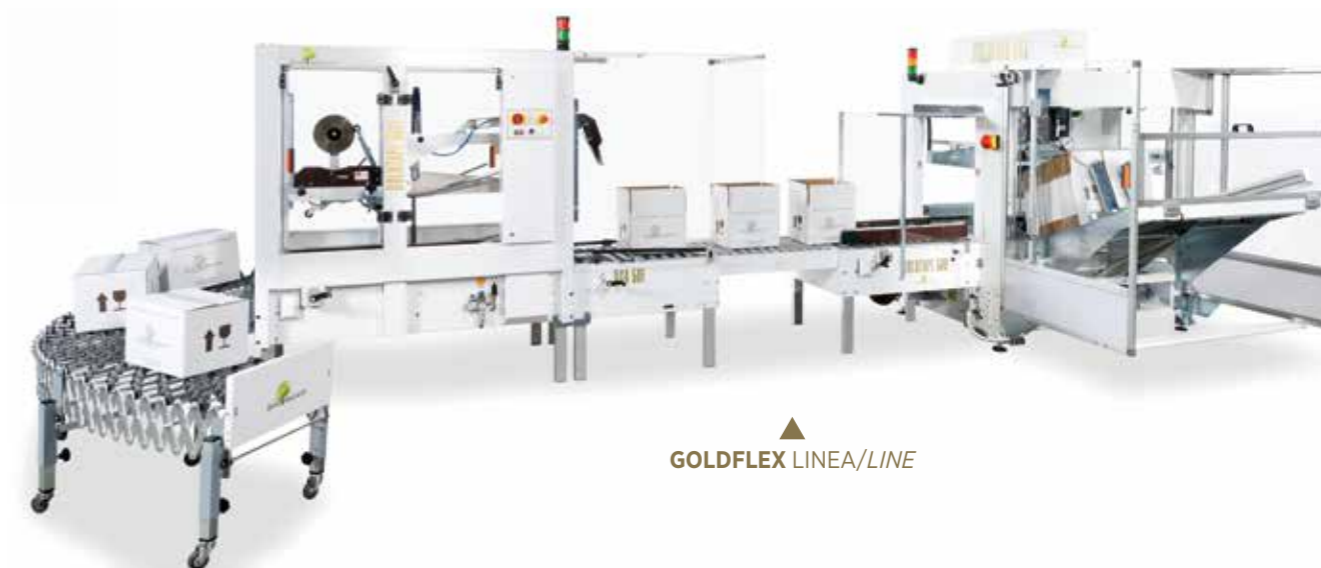
▲ GOLDFLEX LINEA/LINE