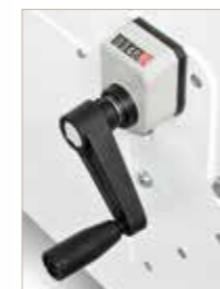
▲ INDICATORI DI POSIZIONE POSITION INDICATORS