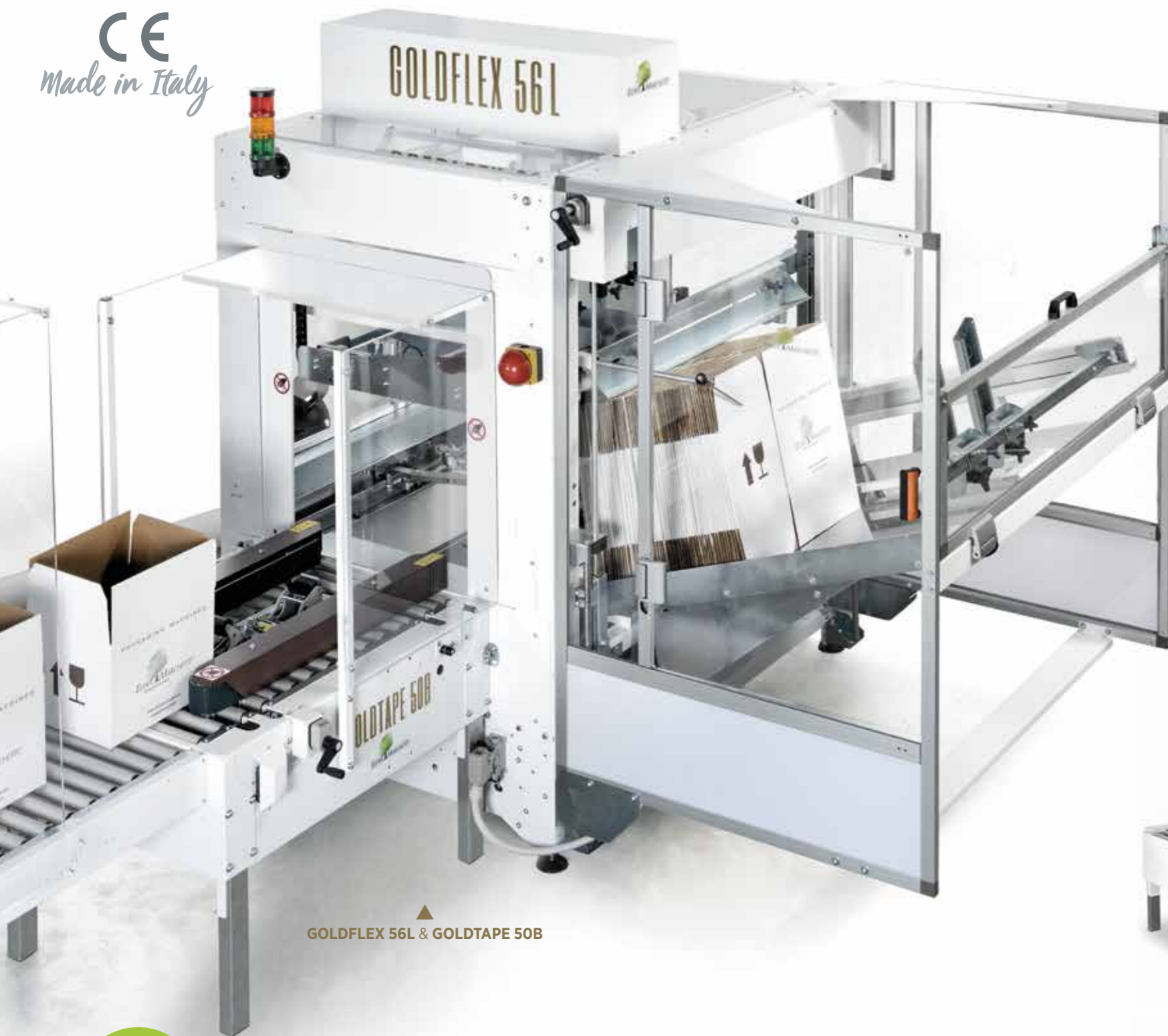
GOLDFLEX 56L & GOLDTAPE 50B