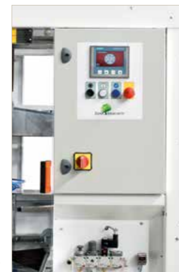
PANNELLO DI CONTROLLO ELECTRONIC PANEL ▶